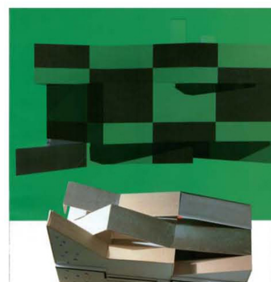
TOITURES - PLSISSEMENTS