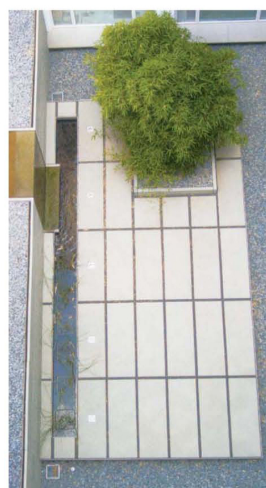
TRAITEMENTS DE SOLS