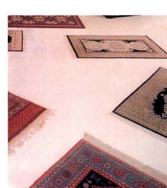
PLEINS - VIDES